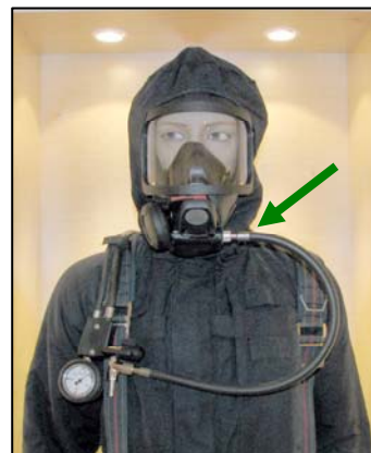
Slang med rak koppling