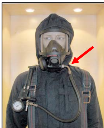
Slang med vinklad koppling

Andnings slangen som går från manöverenheten har vid masken haft en vinklad koppling. Från juni 2008 kommer den att ersättas av en slang med rak koppling. Den raka kopplingen ger bättre följsamhet vid huvudvridningar.